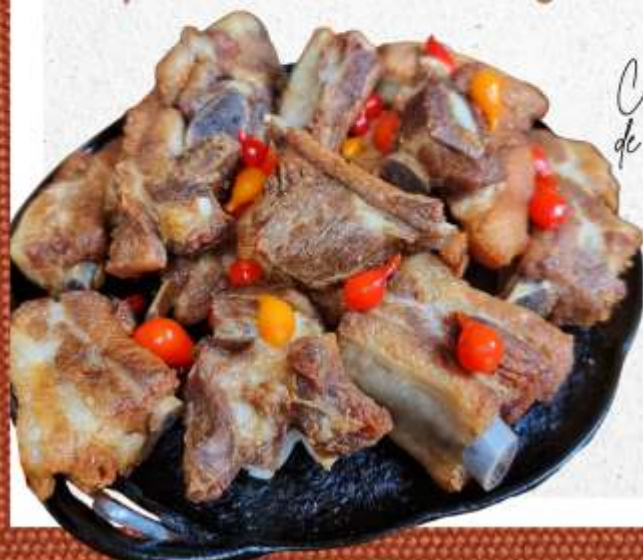
Costelinha de Porco