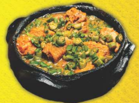
Frango com Quiabo