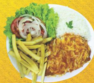
Filé Mignon à Parmegiana