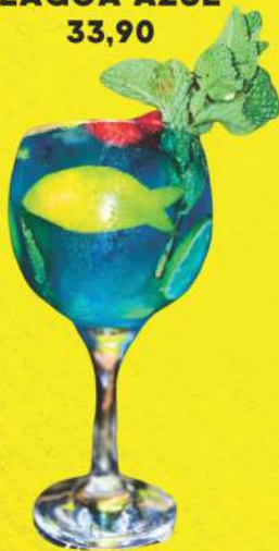
LAGOA AZUL 33,90

Vodka, Curaçau Blue, suco de limão e soda.