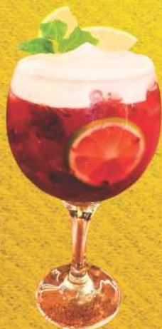
GIN TÔNICA SEAGERS - 32,90

Tequila, licor de laranja e suco de limão.