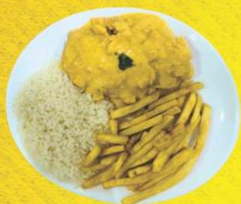
Strogonoff de Frango