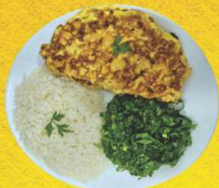
Omelete de Queijo