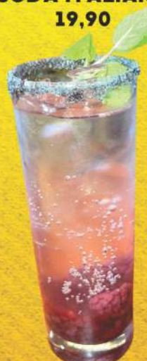
SODA ITALIANA 19,90

Laranja azul, amora, framboesa e maçã verde.