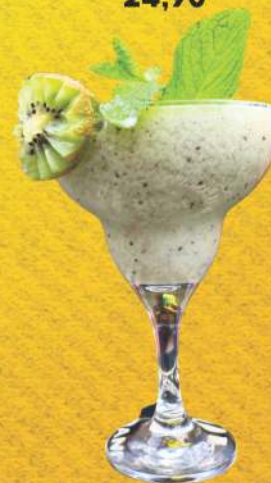
DRINK ANTENA 24,90

Frutas, leite condensado e refrigerante.