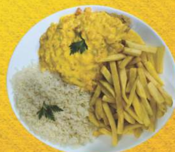
Peixe ao Molho de Camarão