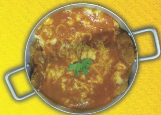
Parmegiana de Frango