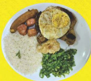
Virado à Paulista