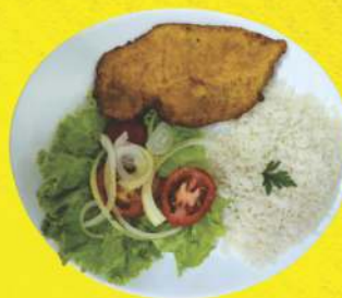
Frango à Milanesa