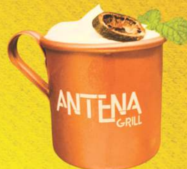
MOSCOW MULE 37,90

Vodka, suco de limão, base de gengibre e água com gás.