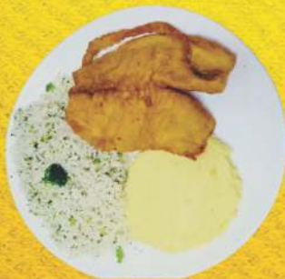
Tilápia à Milanesa