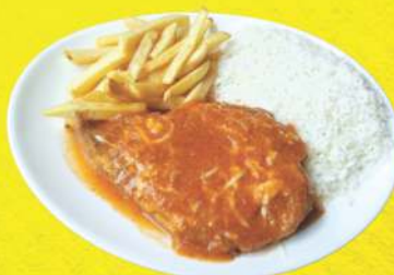
Frango à Parmegiana