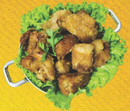
Pernil da Fazenda