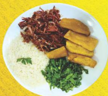
Carne de Sol Desfiada