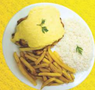
Frango com Creme de Milho