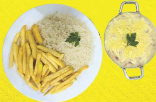
Escondidinho de Carne de Sol