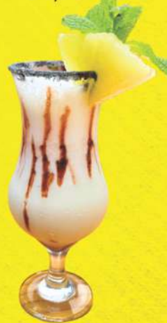
PIÑA COLADA 34,90

Rum, leite de coco, leite condensado, abacaxi e coco ralado.