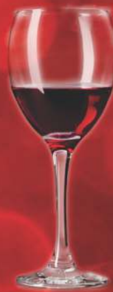
Taça de Vinho Seco 14,90