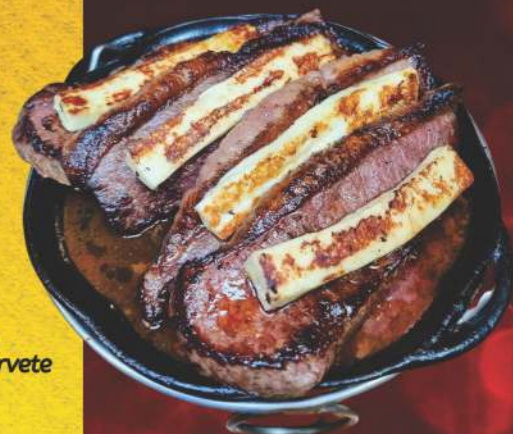
Picanha do Chef