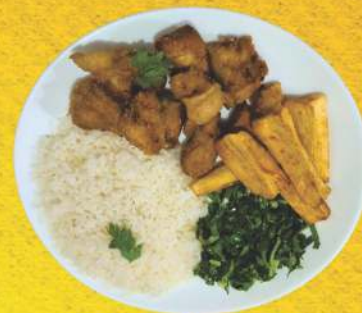
Pernil da Fazenda