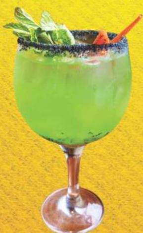
GIN TÔNICA TANQUERAY - 39,90