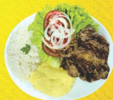
Filé Mignon Grelhado