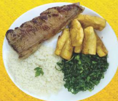
Picanha do Chef