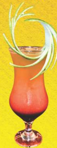
SEX ON THE BEACH 34,90

Suco de laranja, xarope de framboesa, licor de pêssego e vodka.